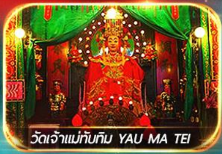
วัดเจ้าแม่ทับทิม YAU MA TEI