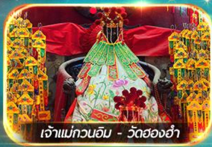
เจ้าแม่กวนอิม - วัดสองอ้า