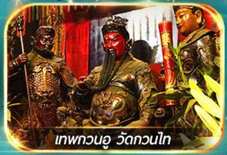
เทพกวนอู วัดกวนไท

พามูไหว้พระขอพร 8 วัดดัง, อิสระช้อปปิ้ง 1 วันเต็มแบบจุใจ