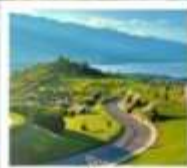
กุช่าอวั้นเซียงชาน