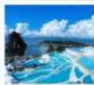
ซานโตรีนต้าหลี่