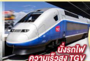
นั่งรถไฟ ความเร็วสูง TGV