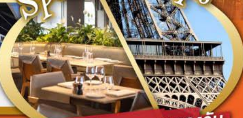
รับประทานอาหารกลางวัน บนหอคอยเฟลา