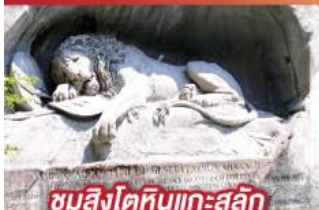
ชมสิงโตหินแกะสลัก