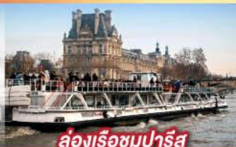
ล่องเรือชมปารีส