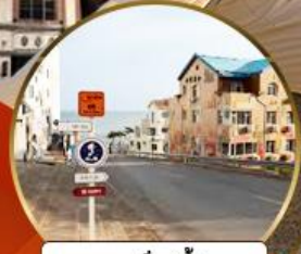
ถนนอ่าวจีปา