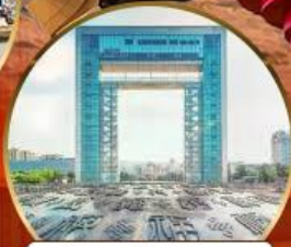
ประตูแห่งความสุข

山东航空公司 SHANDONG AIRLINES SC4080 02.05-08.05 SC4079 21.50-01.55