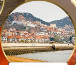
ซาร์จื่อซ่า