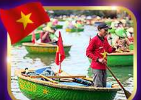
เรือกระด้ง หมู่บ้านก๊อบกาน