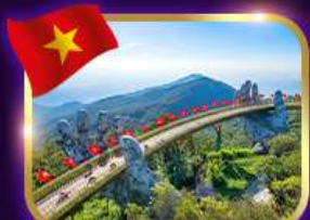
สะพานมือสีทอง บานาฮิลล์