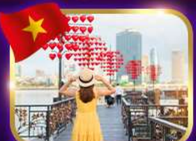
เชคอินสะพานแห่งความรัก