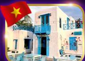
คาเฟ่สุดชิค ซานทรา มาริน่า