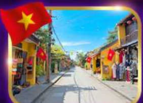
เมืองเก่ามรดกโลก ฮอยอัน