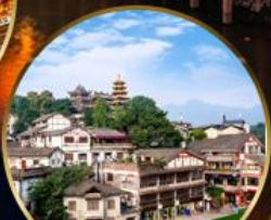
เมืองโบราณฉือจี้เป่