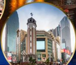
ถนนคนเดินเจียฟางเป่