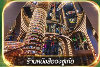
ร้านหนังสือจงซูเก้อ

เที่ยวชม 2 อุทยาน ปี้เฟิงโกว & จิวจ้ายโกว (รถเหมา)