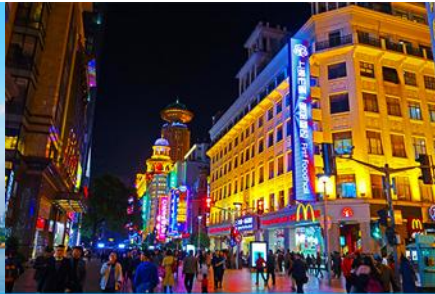
ถนนคนเดินหนานจิงลุ่