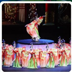
โช่ว FOSHAN QIANGUING