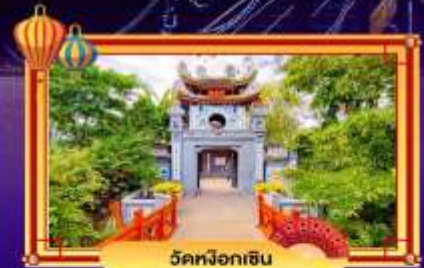
วัดน็อกอิน