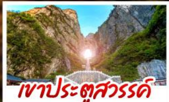
เขาประตูลสวรรค์