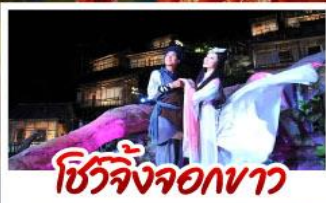
โชว์จิ้งจอกขาว