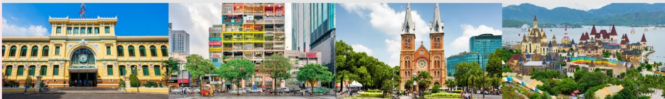
ไพรชฌ์กลางโฮจิมินห์