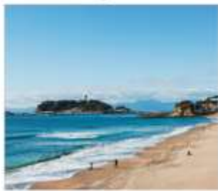
เกาะเอโนชิมะ