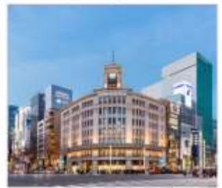
กินซ่า ช้อปปิ้ง