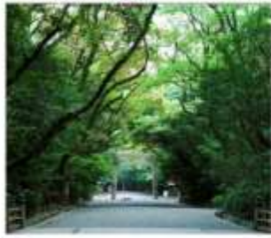
ศาลเจ้าอัสึตะ