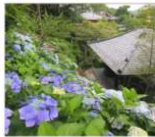
วัดฮาเซเดระ(เดรนเยีย)