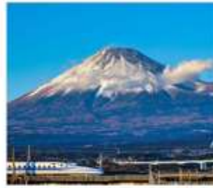
นั่งชินคันเซนชมฟูจิ