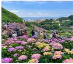
เทศกาลดอกไฮเดรนเยีย