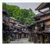
หมู่บ้านโบราณนารายิ จุกุ