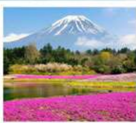
ทะเลสาบโมโตสุ ทุ่งพืชมอส