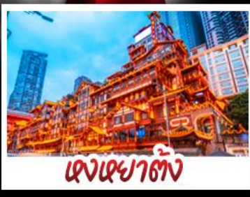
ตงเฉยตัง