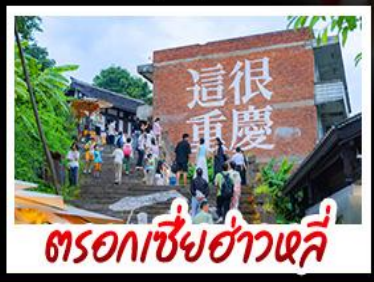
ตรอกเซี่ยฮ่าวหลี่