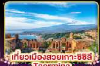
เที่ยวเมืองสวยเกาะซซิลี Taormina