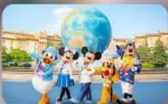
อิสระตามอียาสัย 2 วัน

HOTEL ASIA NARITA ห้องเตียงสามมาตรฐานญี่ปุ่น