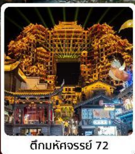
ตึกมหัศจรรย์ 72