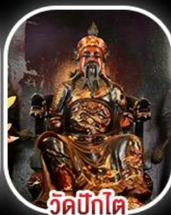
วัดบิกิต