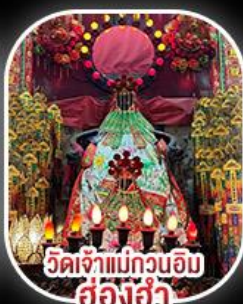
วัดเจ้าแม่กวนอิม สองฮ่า