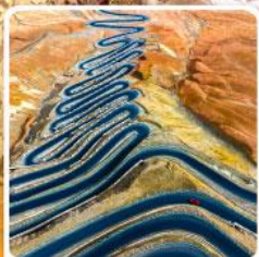
ถนนผานหลงกู่ต้าว