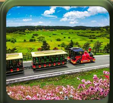
“ อุทยานเขานางฟ้า ”