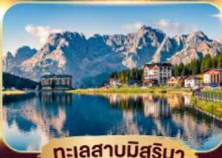
ทะเลสาบมิสุรีนา