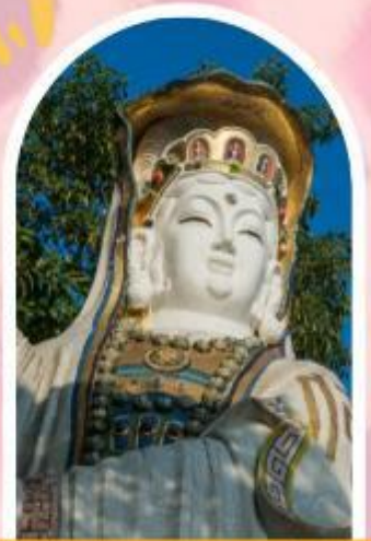
ริพลัสเบย์ รับพลังงานดี เสริมพลังดวงจัญ