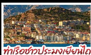
ทำเรือชาวประมงเยียนโก