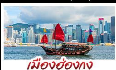
เมืองฮองกง

เมืองเก่าซิงเต่า - วิวเมืองฮองกง โรงเบียร์ซิงเต่า - ทำเรือชาวประมงเยียนโก