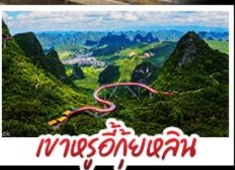
เขาตรู้อีกุ้ยหลิน