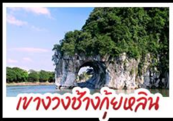
เขางวงช้างกุ้ยหลิน