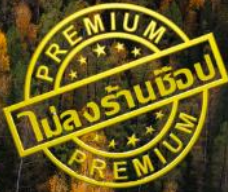
หาดห้าสี