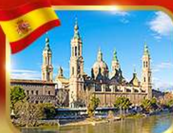
วิหารพระแม่มาเรีย ซาราโกซา