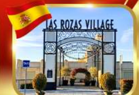
Las Rozas Village ฮากาลีเิน