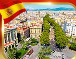
ลาร์มบลาสตริก บาร์เซโลนา