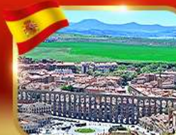
เที่ยวเมืองมรดกโลก ซโกเวีย