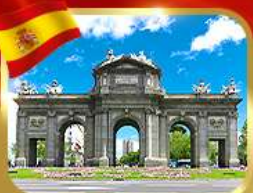
เข็ควินประตูอัลกาลา มาดริด