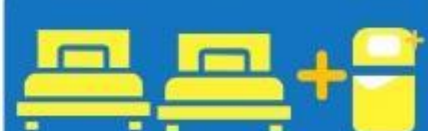
เตียง 3 ท่าน คั่นอนเสริม TRIPLE