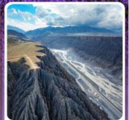
แกรนด์แคนยอนคู่ซานจื่อ