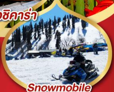
Snowmobile วิวเทากุลมาร์ค ราคาเริ่มต้น