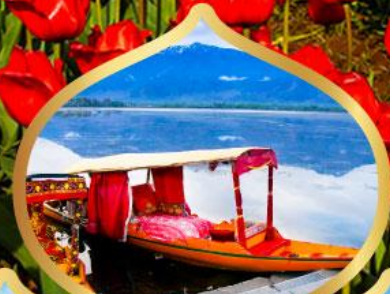
ล่องเรือชิคาร่า