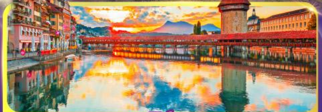
ลูซิิร์น

GO3MXP-SQ002 • ซ้อปิ้ง Serravalle Outlet