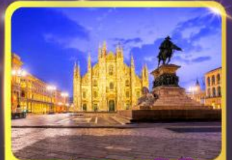
มหาวิหารคูโอโม