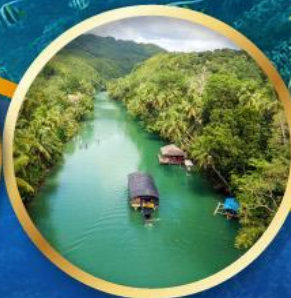
ล่องเรือแม่น้ำโลบ็อก