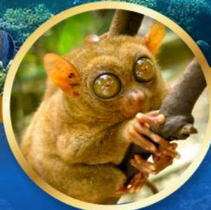
ลิงทาร์เซีย