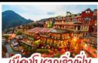
เมืองโบราณจิ่วเฟิ่น

ฟาร์มแกะซิงจิง - ทะเลสาบสวี่นจินตรา จิ่วเฟิ่น - หมู่บ้านประมงหลากสี - ไทเป 101 หมู่บ้านสายรุ้ง - ตลาดล่าหู่ & ซีเหมินติง ปลาประ-ธานธิบดี - เขียวหลงเป่า