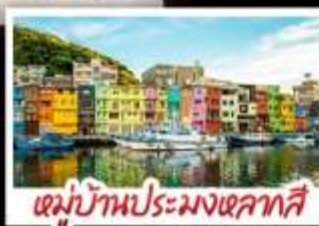
หมู่บ้านประมงหลากสี