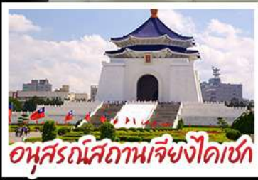
อนุสรณ์สถานเจียงไคเชก