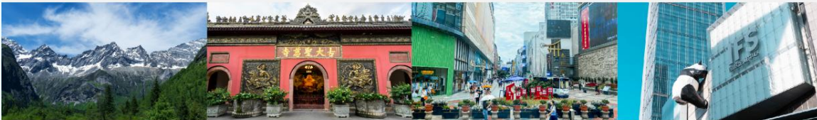
ภูเขาสีดรุณี (หุบเขาชวงเจียวโกว)