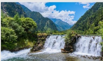
อุทยานแห่งชาติปี่เฟิงโกว