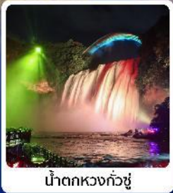
น้ำตกหวงกั๋วชู่