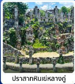
ปราสาทหินเย่หลางกู่