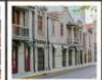
แลนด์มาร์กจากหยวน