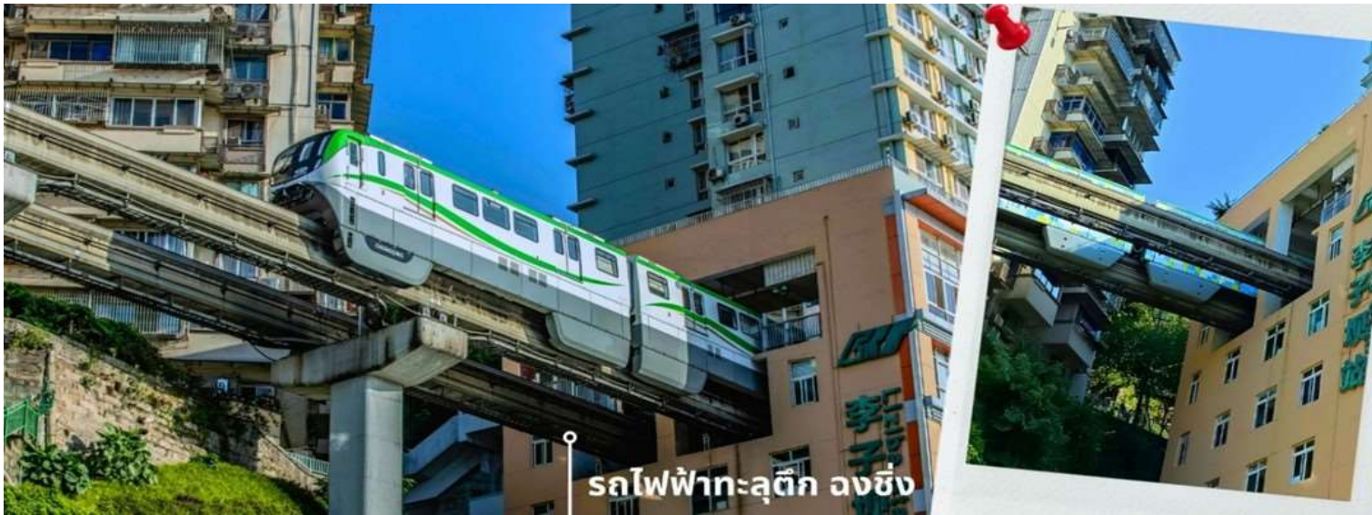
รถไฟฟ้าทะลุตึก ลงชิง

ผู้โดยสารบนขบวนรถไฟและผู้เข้าชมจากจุดชมวิวที่ต่างตื่นตื่นไปตามๆกันกับการที่ได้เห็นรถไฟวิ่งทะลุตึกนี้ สถานี Liziba ได้รับการยกย่องให้เป็น 1 ในสถานที่สำคัญที่สะท้อนความเติบโตของจีนตลอด 70 ปี ซึ่งไม่ได้เกิดขึ้นโดยบังเอิญ รถไฟฟ้าทะลุตึกนี้คือตัวอย่างของความอัจฉริยะในการออกแบบการคมนาคมในเมืองภูเขาแห่งนี้ให้ท่านได้สัมผัสประสบการณ์กับการขึ้นนั่งบนรถไฟเพื่อผ่านทะลุตึกและเก็บภาพบรรยากาศ