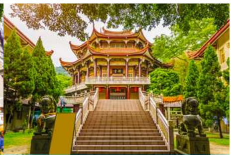
วัดหนานกุ๊วซื่อ