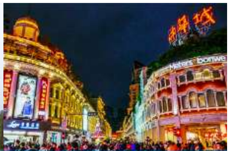
ถนนคนเดิน จวซาลู่