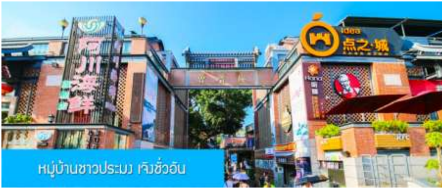
หมู่บ้านชาวประมง เจิวชว้ออัน