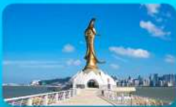
เจ้าแม่กวนอิมริมทะเล

NANYANG SEASCAPE HOTEL หรือเทียบเท่า 4 ดาว