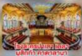
โรงละครปลัสเดลา เบลลา มูสิกกา คาตาลาซา