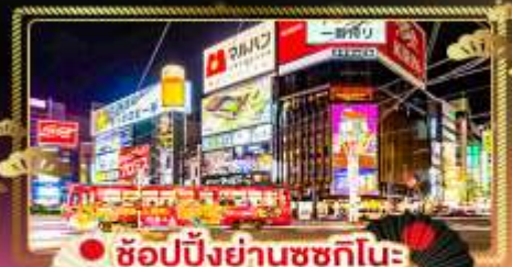
• ช้อปปิ้งย่านซุกุทิมะ