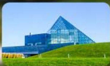
Glass Pyramid HIDAMARI