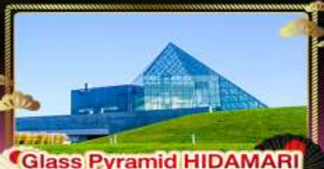
• Glass Pyramid HIDAMARI