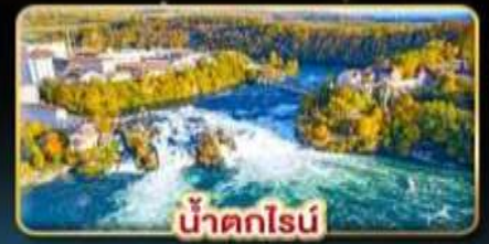
น้ำตกไรน์