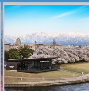
“TOYAMA KANSUI PARK”