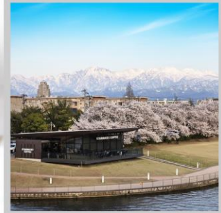
“TOYAMA KANSUI PARK”