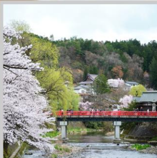
“TAKAYAMA OLD TOWN”