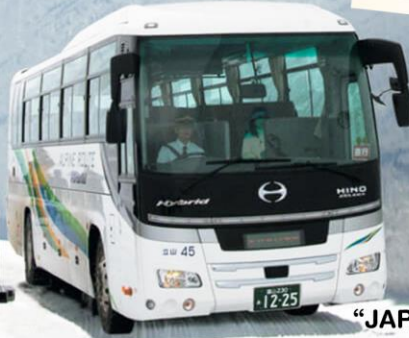
“JAPAN ALPINE ROUTE”