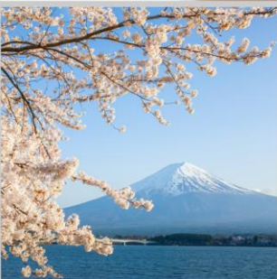
“LAKE KAWAGUCHIKO SAKURA”