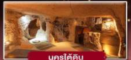
นครใต้ดิน