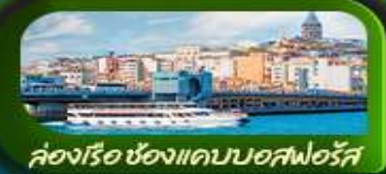
คลองเรือช่องแคบบอสฟอรัส