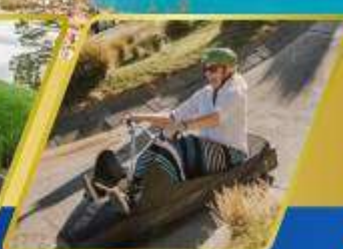
เล่นลู่ที่ควีนส์ทาวน์

AUCKLAND / ROTORUA / CHRISTCHURCH FOX GLACIER / FRANZ JOSEF / QUEENSTOWN พักอ็อกแลนด์ 2 คืน / ไสโตรว์ 1 คืน / พักโครสต์เชิร์ช 2 คืน พักฟรานซ์โจเซฟ 1 คืน / ควีนส์ทาวน์ 2 คืน