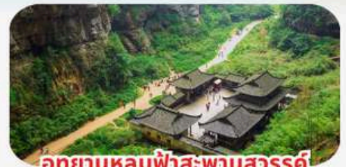
อุทยานหลุมฟ้าสะพานสวรรค์