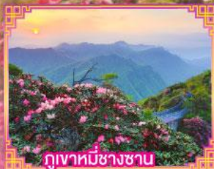
ภูเขาหมีข้างซาน