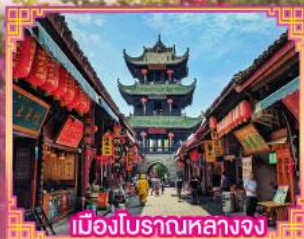
เมืองโบราณหลางจง